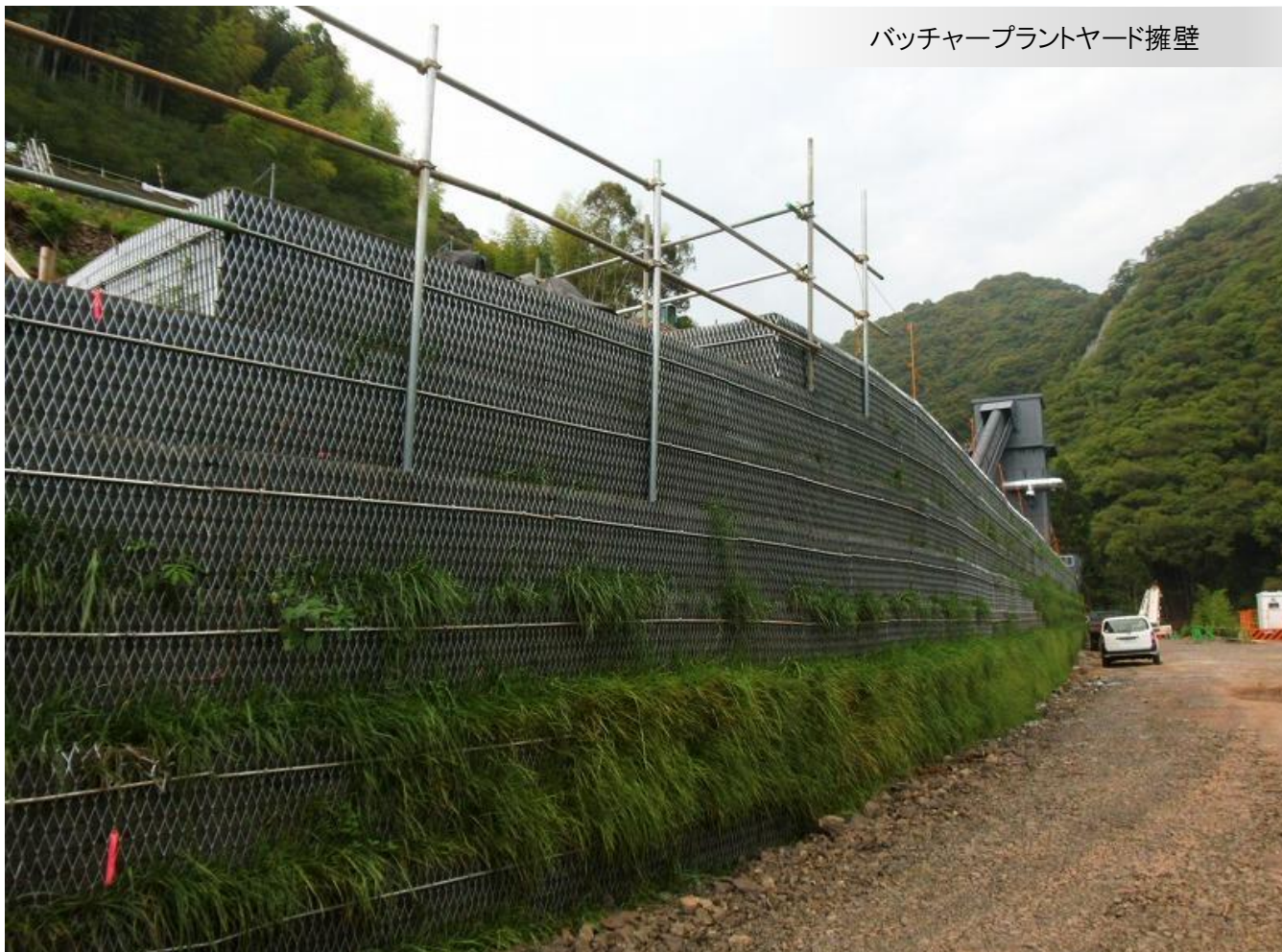
バッチャープラントヤード擁壁