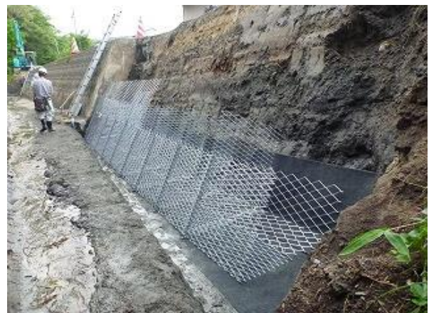
② 設置位置に並べる