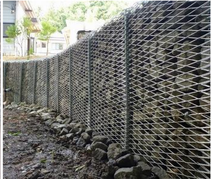
宮城県)仙台土木事務所/北部1道路管理業務(直勾配)