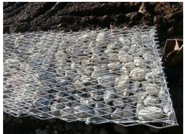
④ 天端蓋材を取付けて、完成!