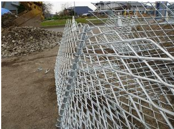
① コイルと連結棒で組立