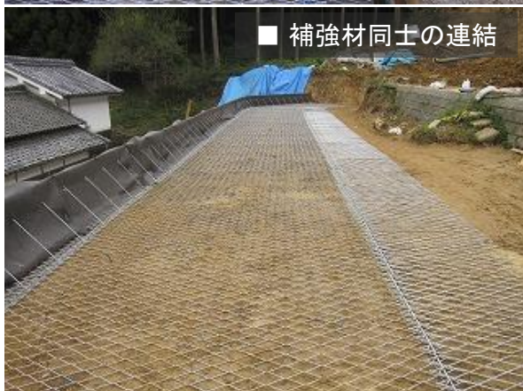
■ 補強材同士の連結