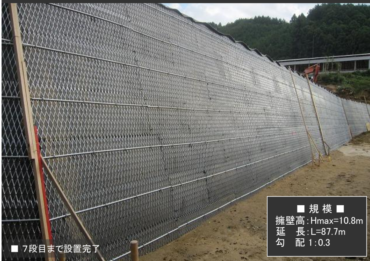
■ 7段目まで設置完了

■ 規模 ■ 擁壁高: H_{max}=10.8m 延長: L=87.7m 勾配: 1:0.3