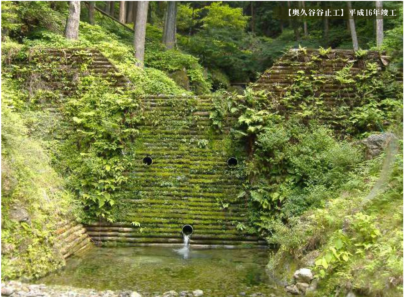
【奥久谷谷止工】平成16年竣工

経年調査のため訪れた三重県松阪管内の現地。自然に包まれるような場所。そこに居場所を見つけた間伐フォームレスに、心から感動しました。