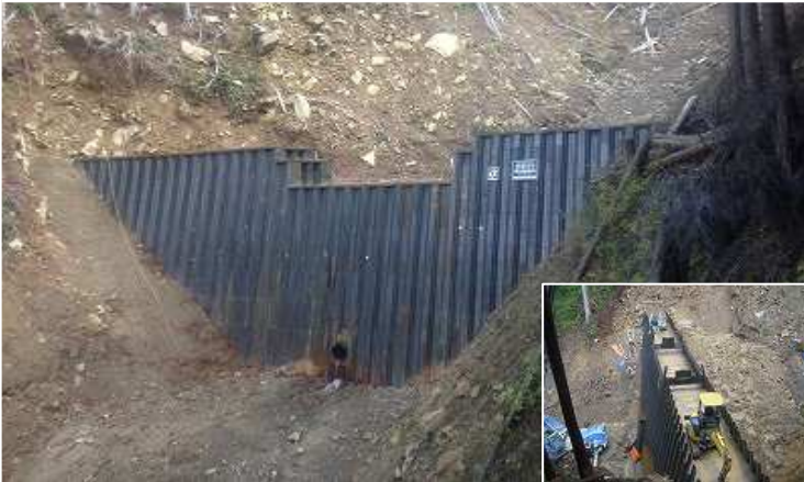
林)和歌山森林管理署【愛賀合】 ダブルウォール (LDW)