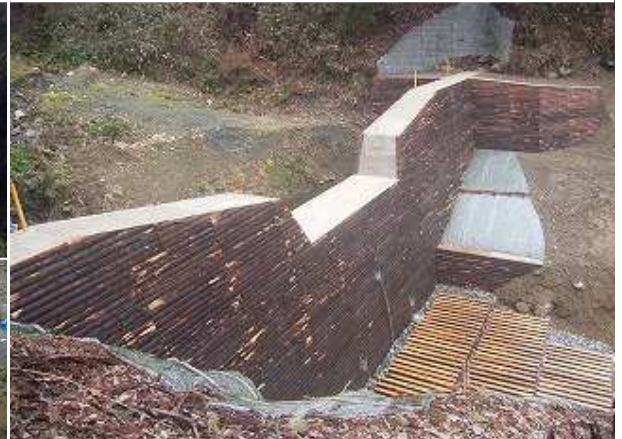
福井県)奥越農林総合事務所【材木洞】 間伐フォームレス (残存型枠)