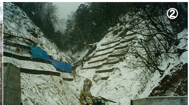
② 青森県) むつ土木事務所【新湯川】 ネックス (NEX) 柵工