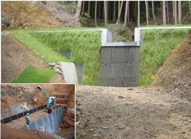
三重県)津農林事務所【城山】 ダブルレックスウォール (DLXW)