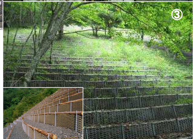
③ 国) 静岡河川事務所【大谷崩】 ネックス (NEX) 柵工