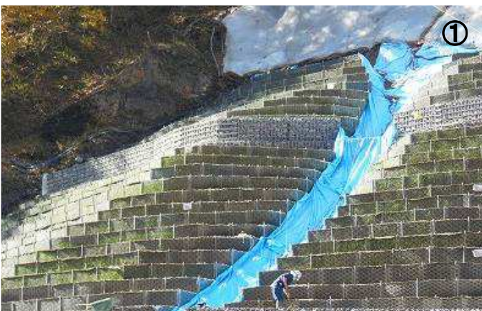
① 国) 日光砂防事務所【野 門】 ネックス (NEX) 柵工