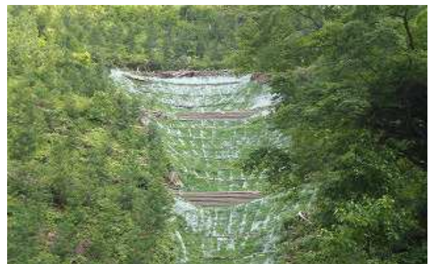
林)塩那森林管理署【シドキ地区】/間伐ブロック/ン (BLN)